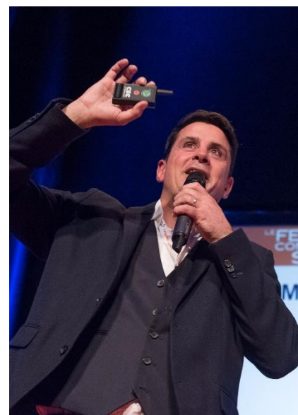
Sébastien Kübler

Lorsque les soignants travaillent avec des personnes âgées, leurs discours et leurs actions doivent encore changer pour s'adapter. Véronique Tapia, aide-médico-psychologique dans un EHPAD 2 , insiste sur l'importance du choix des mots chez les aînés car il contribue à une attitude adaptée. Certains aînés ont intégré le fait qu'il est normal de restreindre leur liberté. Pourtant, cette liberté contribue au sentiment d'utilité et au bonheur des personnes âgées. Le soignant doit donc impérativement ajuster ses paroles pour transformer le regard de la société envers les aînés.