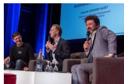
Table ronde « Intelligence Artificielle et Communication »