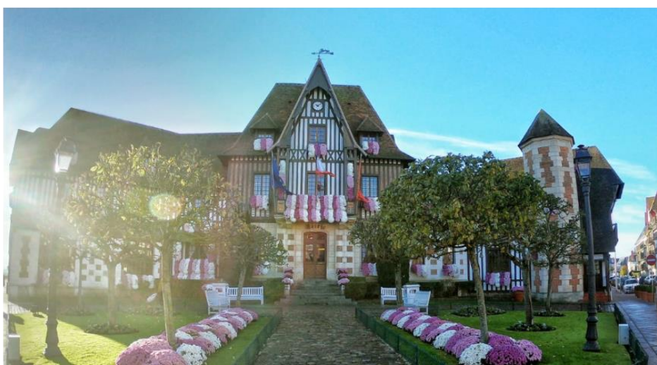
Deauville a accueilli la 29ème édition du Festival de la Communication Santé