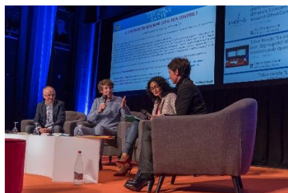
Table ronde « Le Discours du soignant est-il bien compris »

D'autres pays ont mis en place des outils qu'il serait judicieux de tester tel qu'inciter les médecins à préparer leurs consultations et encourager le patient à écrire ses questions avant le rendez-vous. Il faut également inculquer aux soignants des techniques de communication, comme la reformulation, ou encore mettre en place des simulations qui les prépareront aux consultations et à l'annonce de mauvaises nouvelles.