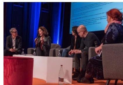
Table ronde « Ethique et Vieillesse »

Une réalité que Camille Théron-Charles a vécu en tant que mère d'un enfant malade. Confrontée parfois à des discours non rassurants des soignants, elle milite également pour que les techniques de communication soient appliquées en milieu médical. En effet, la communication non-verbale revêt une grande importance. Ainsi, « on peut modifier le fond par la forme » selon la présidente de l'AMFE. En plus des techniques de